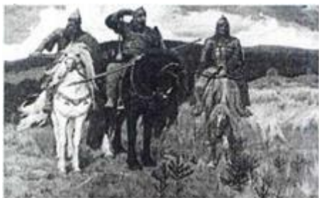
Богатыри, Автор - Васнецов