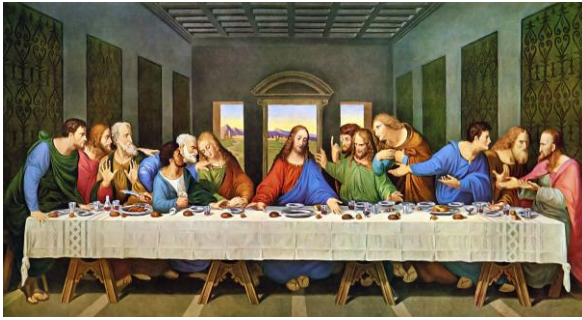
Леонардо да Винчи

34. Что характерно архитектуре французского Северного Возрождения акцент на строительстве церковных сооружений строительство преимущественно королевских дворцов* стремление к строительству общественных зданий строительство дворцов и частных вилл