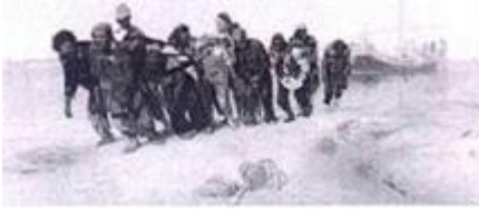
Бурлаки на волге