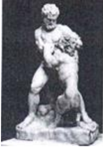
А) греческая, б) Геракл, борющийся со львом, в) Лисипп