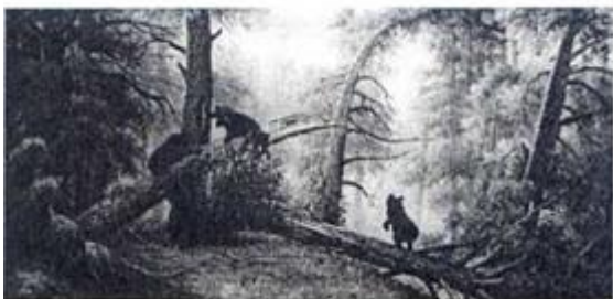
Утро в сосновом лесу, Автор - Шишкин