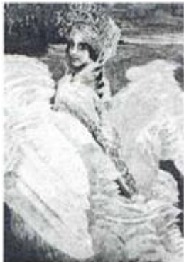
Царевна – лебедь, Автор – Врубель

Христос в пустыне Неутешное горе Неизвестная Русалки (Майская ночь)