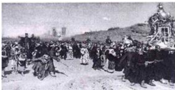
Крестный ход в курской губернии