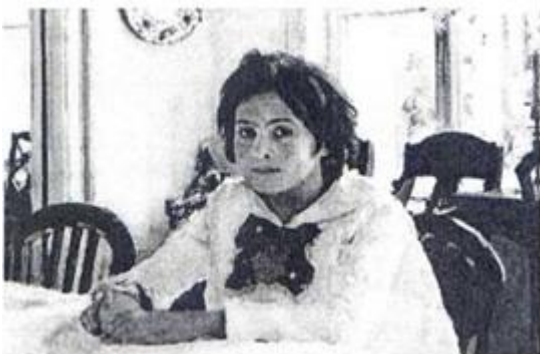
Девочка с персиками, автор - Серов