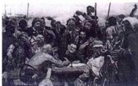
Запорожцы пишут письмо турецкому султану